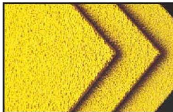
Una muestra de los granos existentes, de izquierda a derecha: súper grueso, grueso y fino.