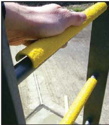
Cubiertas para peldaños (Mostrando lo fácil de instalar)