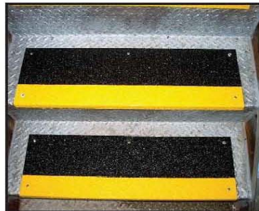
Cubiertas para escalones